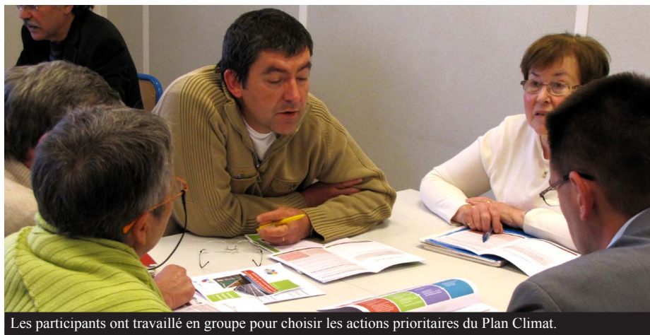
Les participants ont travaillé en groupe pour choisir les actions prioritaires du Plan Climat.